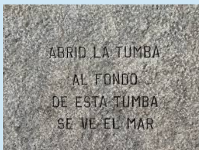
Epitafio de Huidobro.

“Aquí yace Molière, el rey de los actores. En estos momentos hace de muerto y de verdad que lo hace bien”