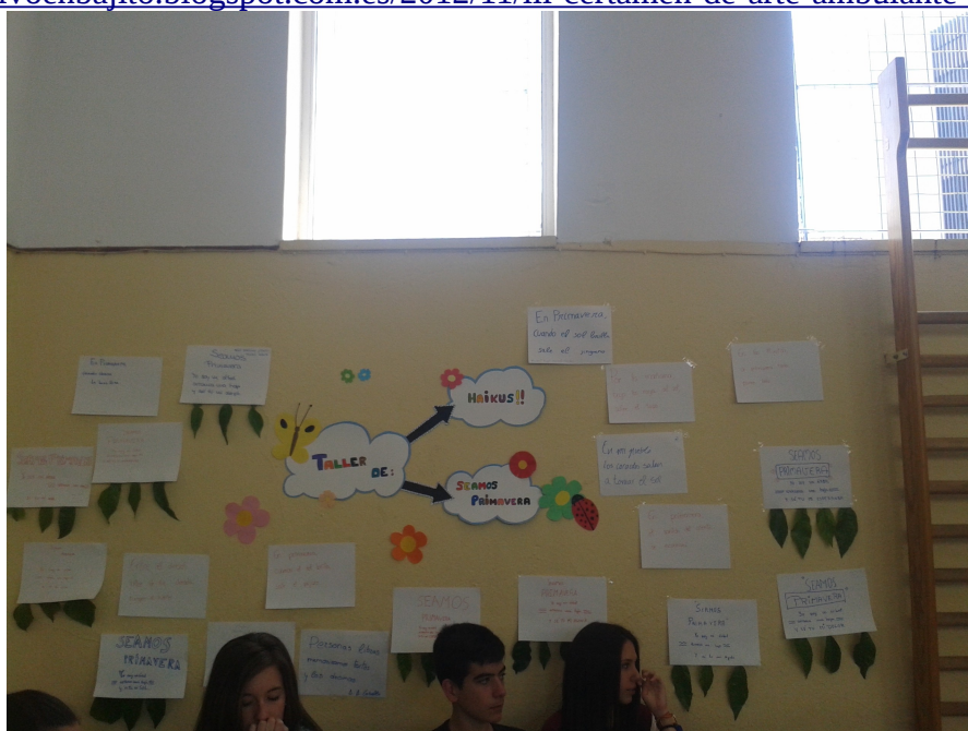
(Ejemplo del Taller SEAMOS PRIMAVERA)