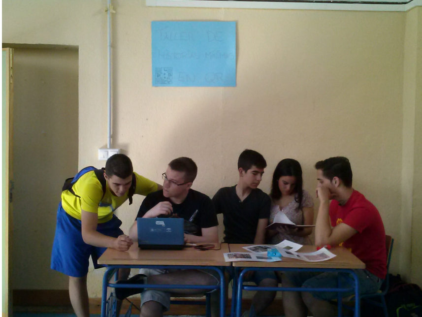
Grupo de Historias Mínimas y QR