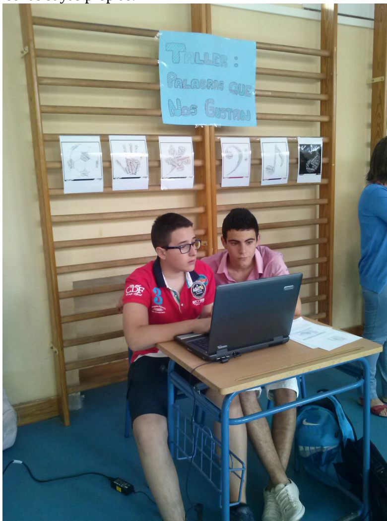
(Taller de PALABRAS QUE NOS GUSTAN)

Todos nuestros alumnos fueron pasando por la FERIA DEL LIBRO, además del personal laboral y los padres y madres que pudieron. Todos ellos podían disfrutar de un 20% de descuento, gracias a nuestros colaboradores: AMPA SANTA BÁRBARA y LIBRERÍA RAFA , sin ellos esta feria y la del curso pasado sería imposible. Sirvan estas líneas como agradecimiento a su generosidad y buena disposición hacia estas iniciativas necesarias en los centros educativos.