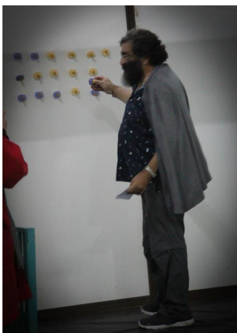
En ellas aparece Antonio Gómez, uno de los artistas experimentales más influyentes de la literatura española.

Se recomienda intentar repetir la performance art con el alumnado que haya realizado la actividad.